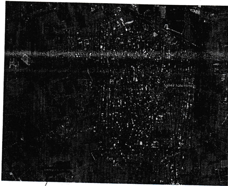
Immobile oggetto dell'intervento